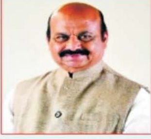
ಶ್ರೀ ಬನವರಾಜ ಎಸ್.ಬೊಮ್ಮಾಣ್ಣ ಸನ್ಮಾನ್ಯ ಮುಖ್ಯಮಂತ್ರಿಗಳು, ಕರ್ನಾಟಕ ಸರ್ಕಾರ

ಸೈರಾಬಾಗ್, ನಂ.19/4, 2ನೇ ಮಹಡಿ, ಕನ್ನಿಂಗ್‌ಹ್ಯಾಂ ರೋಡ್, ಬೆಂಗಳೂರು-52 ಕಛೇರಿ ದೂರವಾಣಿ : 080-22285561, 62, 63, 65