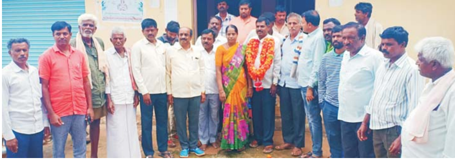
ಉಪಾಧ್ಯಕ್ಷರಿಗೆ ಸಹಕಾರ ನೀಡುವುದು ಅಗತ್ಯ ಎಂದರು.